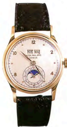
パテック フィリップ Ref.1526

30分積算計を備えたクロノグラフとパーベチュアルカレンダーを搭載。18Kイエローゴールド・ケース。1960年頃製造。落札価格はSfr.280,000 (約2240万円)