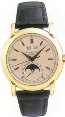
パテックフィリップ Ref.2497

永久カレンダー付きの ポケットクロノメーター。 18Kピンクゴールド・ケース。 1890年製造。 落札価格はHK$3,600,000 (約6120万円)