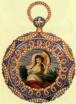
ビゲ&メイラン ミュージカル・ウォッチ

前号でお伝えしたアンティコルムの時計オークション(4月12・13日/ジュネーブ)が無事終了した。 最高落札価を記録したのはバテック フィリップのワールドタイム・ウォッチRef.2523/1。 およそ1億1912万円で落札された。ではここに落札金額上位8モデルを紹介する。