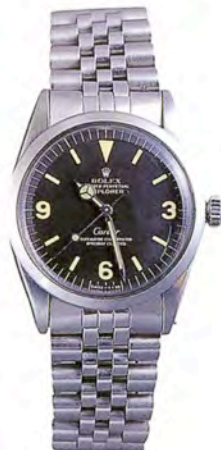
ロレックス エクスプローラー-Ref.1016

文字盤6時位置にムーンフェイズとスモールセコンド、ポインター式の日付表示を備えたパーベチュアルカレンダー。18Kイエローゴールド・ケース。落札価格はSfr.200,000 (約1600万円)