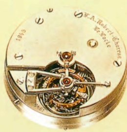
世界最小 トゥールビヨン

タキメーターと30分積算計付きの スプリットセコンド・クロノグラフ。 18Kイエローゴールド・ケース。 Cal.13130。 ケース径33mm。 落札価格は約4388万円