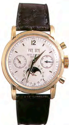
パテック フィリップ Ref.2499

レトログレード式の日付表示を備えたパーベチュアルカレンダー。18Kイエローゴールド・ケース。1937年製造。落札価格はSfr.1300,000 (約1億400万円)