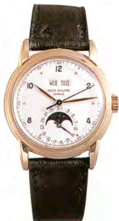
パテック フィリップ Ref.2497

12時位置の小窓で月と曜日表示、6時位置にはムーンフェイズとポインター指揮の日付表示を配したパーベチュアルカレンダー・モデル。18Kピンクゴールド・ケース。落札価格はSfr.420,000 (約3360万円)