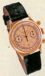
パテック・フィリップ Ref.1463 落札価格約1891万円

Ref.1518のファーストシリーズで、永久カレンダー、ムーンフェイズ、スクエア・プッシュピースのクロノグラフを搭載。文字盤はアラビア数字のゴールド・アブライド・インデックス。Cal.13 o 。18Kイエローゴールド・ケース。