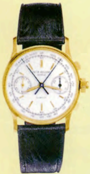
バテック フィリップ Ref.1436

18Kイエローゴールド・ケース& プレスレット。エナメル文字盤に スケルトン針を採用した ワールドタイム・ウォッチ。 1965年製造。 落札価格は約1億1912万円