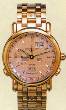
ユリス・ナルダン

来たる5月21日、アンティコルム主催によるニューヨーク時計オークションが開催される。400点を超える出品作のハイライトはトゥールビヨン・ウォッチのコレクションだ。一流メーカーの証といえるこの機構を搭載した腕時計が各社より勢揃いする。また、ヴィンテージ・ウォッチの見所はパテック フィリップのレクタンギュラー・ウォッチだろう。1925年にティファニーで販売されたそのケースには米上院議員の名が記されている。