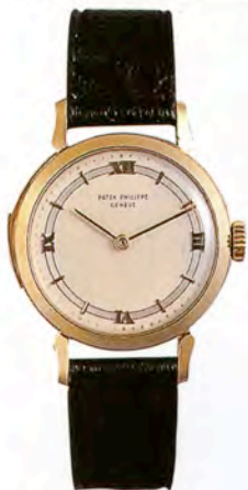
パテック フィリップ Ref.2524

12時位置の小窓で月と曜日表示、6時位置にはムーンフェイズとポインター指揮の日付表示を配したパーベチュアルカレンダー・モデル。18Kピンクゴールド・ケース。落札価格はSfr.420,000 (約3360万円)