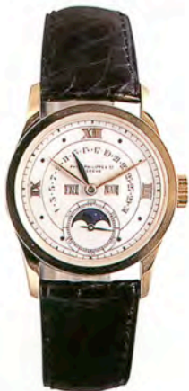
パテック フィリップ Ref.96

深海探査船トリエステ号の外壁に装着され、水深1万908mの水圧に耐えた特性オイスターケース。不落札。