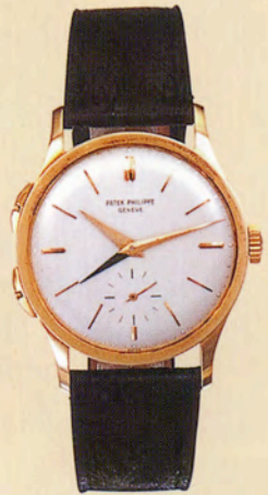
パテック フィリップRef.2597

ステンレススチール・ケース。 タキメーター目盛りとツーカーンター機能付き クロノグラフ。1945年製造。 エスティメートは約5600万~7200万円