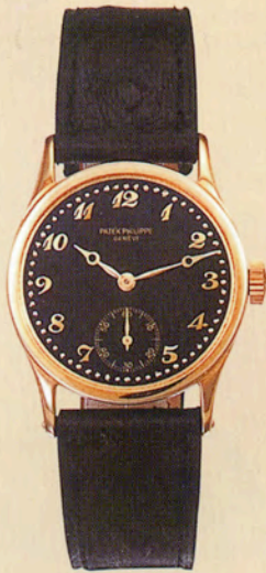
パテック フィリップRef.96

18Kイエローゴールド・ケース。 ブラック文字盤にゴールドの アップルボム・ハンドを採用したカラトラバ。 1935年製造。エスティメートは約120~160万円