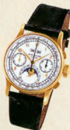
パテック・フィリップ Ref.1518 落札価格約1720万円

1941年に製造をスタートして54年に終了。インデックスのデザインが異なった4つのシリーズが作られている。18Kイエローゴールド・ケースと18Kピンクゴールド・ケースが計281本製造された。そのうちステンレススチール・モデルが4本存在する。