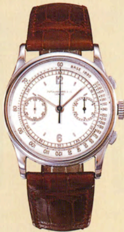
パテック フィリップRef.530

18Kイエローゴールド・ケース。 ブラック文字盤にゴールドの アップルボム・ハンドを採用したカラトラバ。 1935年製造。エスティメートは約120~160万円