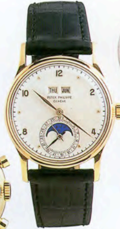
パテックフィリップ Ref.1526

ムーンフェイズ付き 永久カレンダー・クロノグラフ。 18Kイエローゴールド・ケース。 1972年販売。 落札価格はHK$5,000,000 (約8500万円)