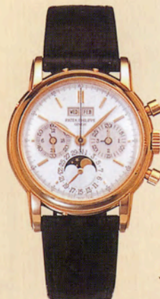
パテック フィリップRef.3970

18Kイエローゴールド・ケース。 永久カレンダー、クロノグラフ、 ムーンフェイズ搭載。 1986年製造。 エスティメートは約444万~504万円