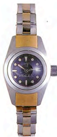
ロレックス Deep Sea Special No.35

湾曲したレクタングル・ケースに小窓表示式のトリプルカレンダーとムーンフェイズを搭載する。プラチナ・ケース。1938年製造。不落札。