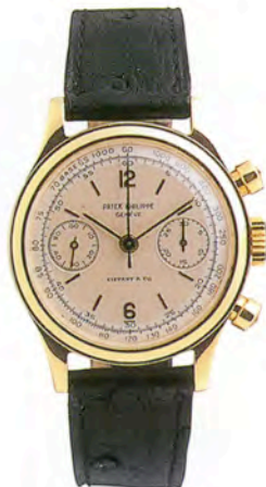
パテックフィリップ Ref.1463

ムーンフェイズ付き永久 カレンダー。18Kイエロー ゴールド・ケース&バックル。1963年製造。 落札価格はHK$1,100,000(約1870万円)