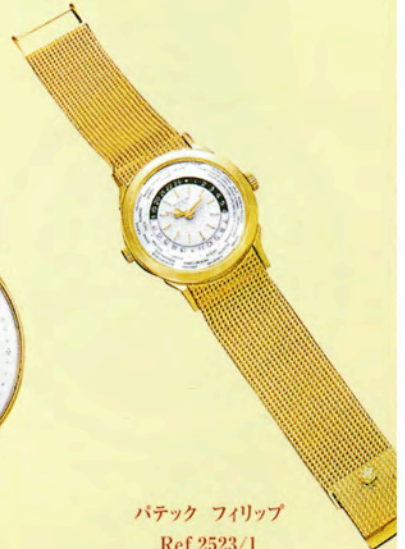
バテック フィリップ Ref.2523/1

ミニッツリピーター・パーベチュアル。 18Kゴールド・ケース。 自動巻き。 60時間パワーリザーブ・インジケーター付き。 1821年に5000フランで販売された。 落札価格は約9437万円