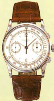
バテック フィリップ Ref.530

パールをセットした18Kゴールドと エナメル・ケースのクォーター リピーター付きミュージカル・ウォッチ。 中国市場に向けて1820年頃に製造された。 直径56mm。 落札価格は約6467万円