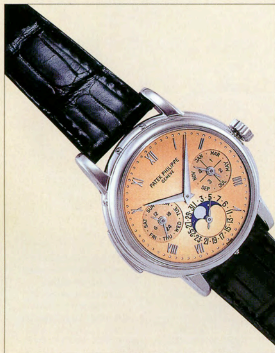
パテック・フィリップ Ref.3974 落札価格約3822万円

昨年12月4日と5日にニューヨークで開催されたアンティコルム社主催のテーマ・オークション「アメリカ時計の芸術」では、パテック・フィリップの腕時計に人気が集まった。その中から特に注目され、高額で落札されたパテック・フィリップの詳細とその落札価格を紹介する。