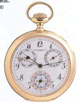
パテックフィリップ 懐中時計

タキメーター付きの 2カウンタークロノグラフ。 ステンレススチール・ケース。 1930年代製造。 落札価格はHK$190,000 (約323万円)