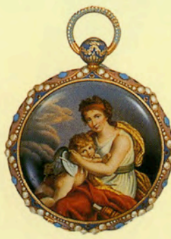
ビゲ&メイラン ミュージカル・ウォッチ

18Kピンクゴールド・エキシビジョン・ ケース入りワンミニッツ・トゥールビヨン。 Fritz Andre&Robert-Charrrue作。 ムーブメント径は19.74mm。 1945年製造。 落札価格は約4388万円