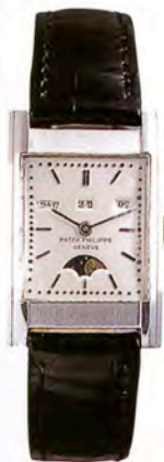
パテック フィリップ トリプルカレンダー

ゴールドのバトンインデックスとローマ数字インデックスを文字盤に配したミニッツリピーター。18Kイエローゴールド・ケース。落札価格はSfr.470,000 (約3760万円)