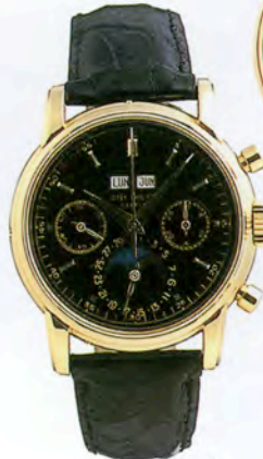
パテックフィリップ Ref.2499

中3針式のクロワゾネ文字盤。 18Kイエローゴールド・ ケース&プレスレット。 1954年製造。 落札価格はHK$900,000 (約1530万円)