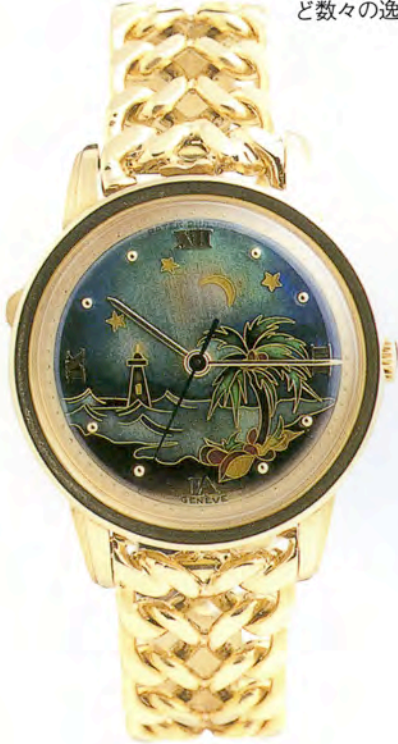
パテックフィリップ Ref.2481

この6月8日と9日の両日、香港のリッツカールトンホテルにてアンティコルム主催の時計オークションが開催された。パテックフィリップのクロワゾネ文字盤や永久カレンダー・クロノグラフなど数々の逸品が登場した中から13本の落札価格をお伝えする。